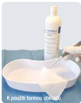
K použití formou obkladu