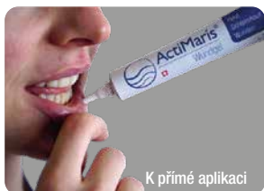
K přímé aplikaci