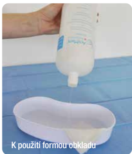
K použití formou obkladu