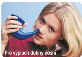
Pro výplach dutiny nosní